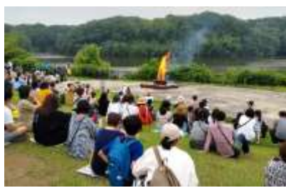
げし び こっこ 夏至のかがり火「コッコ」