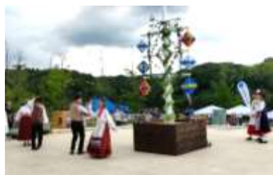
みっどさまーだんす ミッドサマーダンス