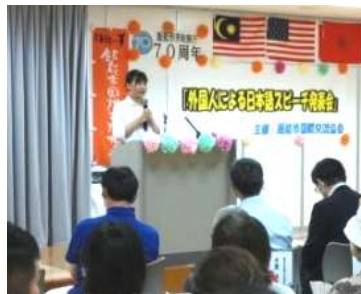
はっぴよう ようす 発表の様子