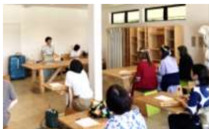
かんてれわーくしょっぷ カンテレワークショップ