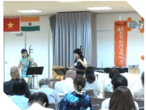
ニコミー♪による「二胡の演奏」