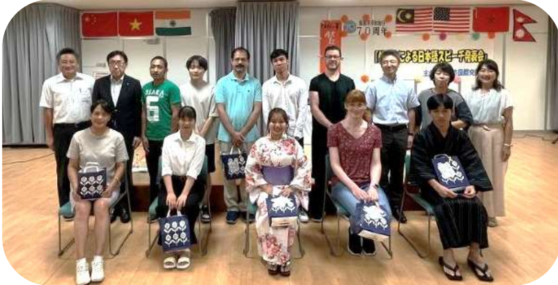
発表者のみなさんと来賓、実行委員との記念写真

また、第2部としてグループ「ニコミー♪」による、中国の伝統的な楽器で ある「二胡」の演奏会もあり、みんなで歌おうのコーナーでは、上を向いて歩 こう、ふるさとの2曲を、美しい二胡の音色に合わせ、会場のみなさんで 合唱しました。