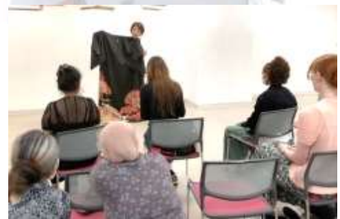
古籟先生から、着物についてたくさんのことを教えていただきました。