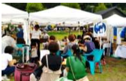
てらもすわーくしょっぷ テラモスワークショップ

なつ みじか ほくおう ねん ひなが げし ひ くりすます なら 夏の短い北欧では、1年でもっとも日の長い夏至の日は、クリスマスと並ぶ こくみん たいせつ しゅくじつ び た ばーべきゅー さうな 国民の大切な祝日として、かがり火を焚いたり、バーベキューやサウナなど ひ しず なつ よる たの す なつ おとす いわ で日の沈まない夏の夜を楽しんで過ごし夏の訪れをお祝いしました。