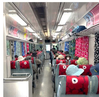
・飯能市フィンランド協会新野会長 （右から2番目） ・マリメッコ電車