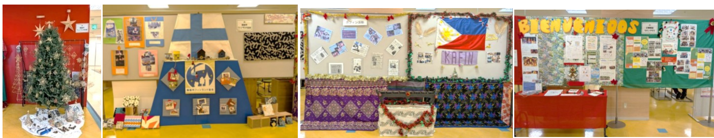
しみんかつどうせんたー えれべーたーまえ こうりゅうひろば かざられた ほくおう ふいりびん なんべい くりすますてんじ 市民活動センターのエレベーター前と交流広場に飾られた、北欧、フィリピン、南米のクリスマス展示

がつついたち にち あいだ しみんかつどうせんたーくりすますてん かいさい 12月1日から25日までの間、市民活動センターでクリスマス展が開催されました。