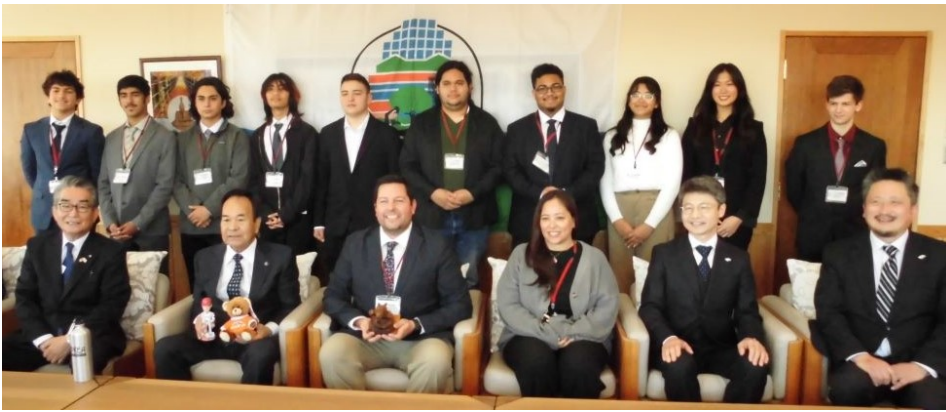
しちょうひょうけいほうもん 市長表敬訪問