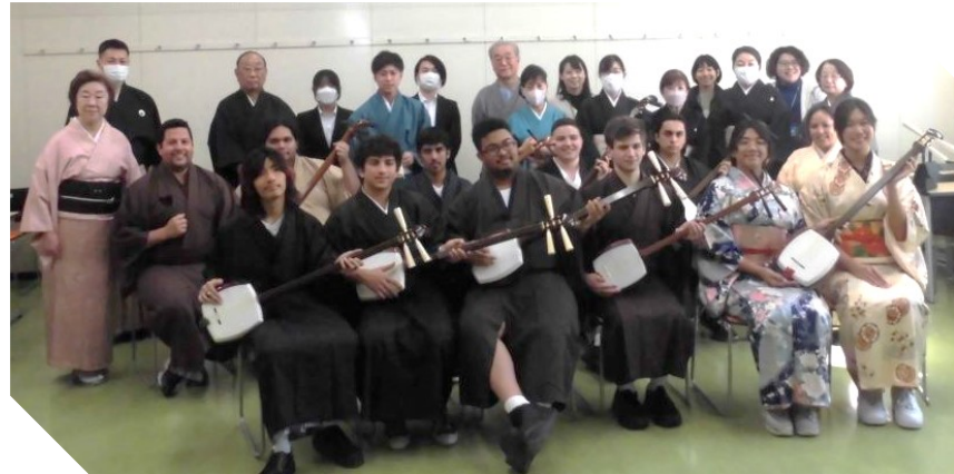
するがだいだいがく きもの きてしゅみせんたいけん 駿河台大学にて着物を着て三味線体験