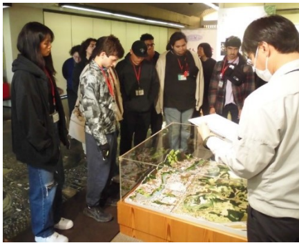
はくぶつかん けんがく 博物館を見学