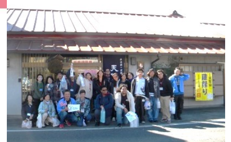
きぎょうほうもん かぶまるなか いがらししゅぞうかぶ けんかく 企業訪問：(株)マルナカと五十嵐酒造(株)を見学