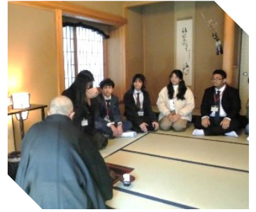
しんのうじ さどうたいけん 心應寺で茶道体験